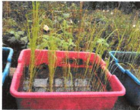
Gambar 1. Sampel padi lokal yang berumur 21 HST